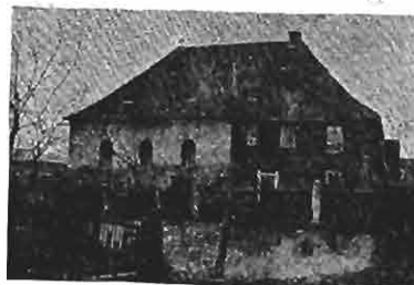
Ehemaliger Tempel in Kleinschüttau bei Karlsbad