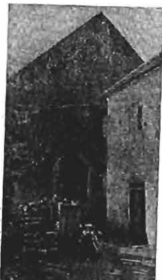
Ehemaliger Tempel in Tutschap