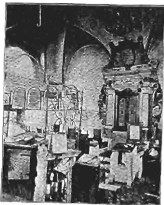
Pötschau: Tempel 1675. AImemor 1688