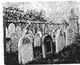
Hřbitov (starý část)