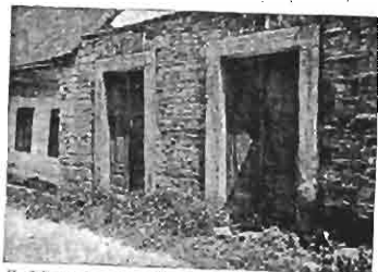
Verfallener Tempel in Grossbock bei Königshof a. d. E.