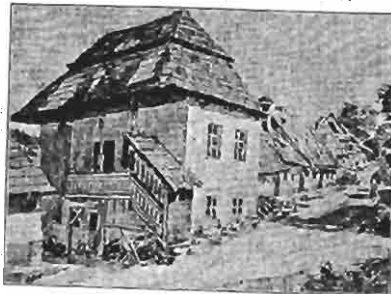
Ehemaliger Tempel in Atlangendorf