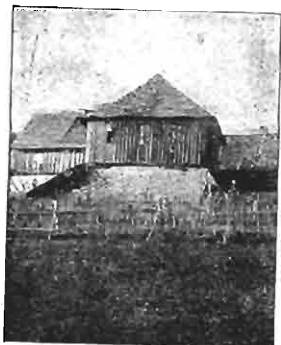
Tempel in Pauten bei Karlsbad